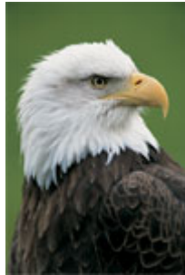
ภาพต้นฉบับ